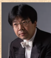
指揮 高関 健